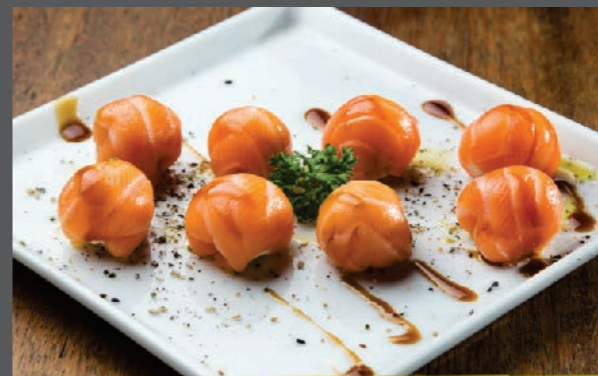
Ball de salmão