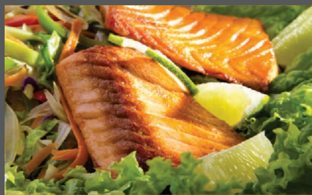
Teppan yaki salmão