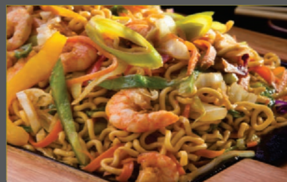
Yakisoba de camarão