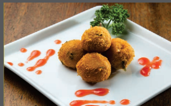
Bolinho de peixe