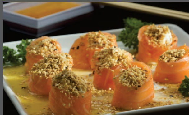
Joul roll com amendoim