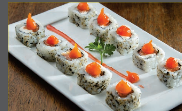
Filadelfia spice uramaki