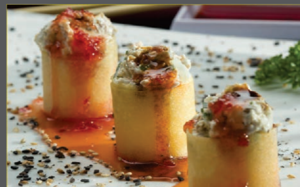
Mini torre crocante