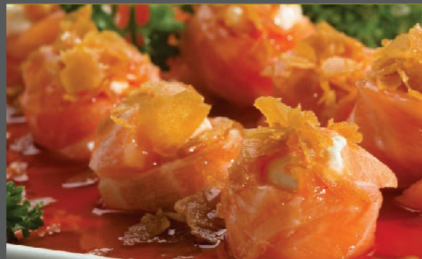
Joul roll crocante