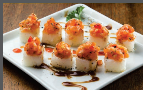
Kentaro spice mix