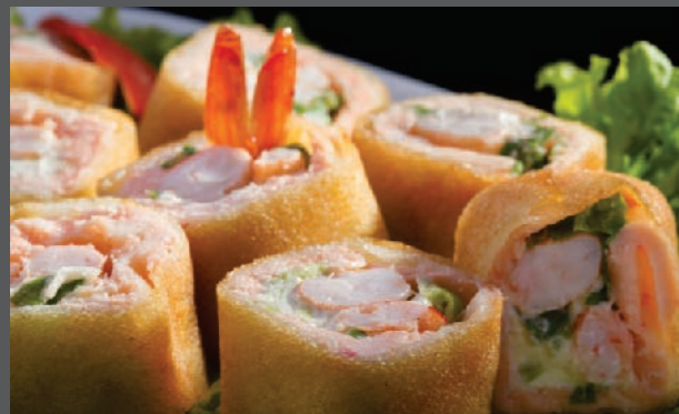
Ebi hot maki